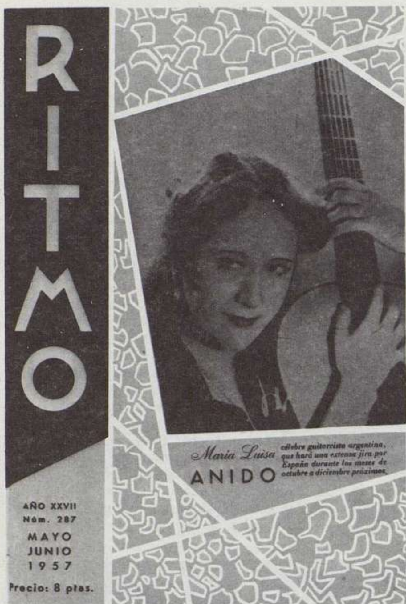
Cubierta del n. 287, mayo-junio de 1957.

fotografía central, naturalmente en blanco y negro, enmarcada entre grandes espacios blancos; en la parte superior, como ya quedó dicho páginas atrás, campeaba el título con la leyenda: «Revista Musical Ilustrada». En efecto, en casi todas sus páginas aparecían fotos o grabados.