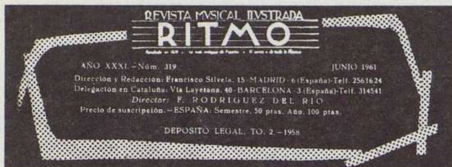
Mancheta del n. 319, junio 1961.

de la cubierta, que presenta una o varias fotografías en caprichosas formas oblicuas de irregulares ángulos, según la última moda del momento, que también afectó al cuadro de la mancheta editorial interior (dislocado en diversos trazos), pero que no fue capaz de alterar la tipografía característica del título.